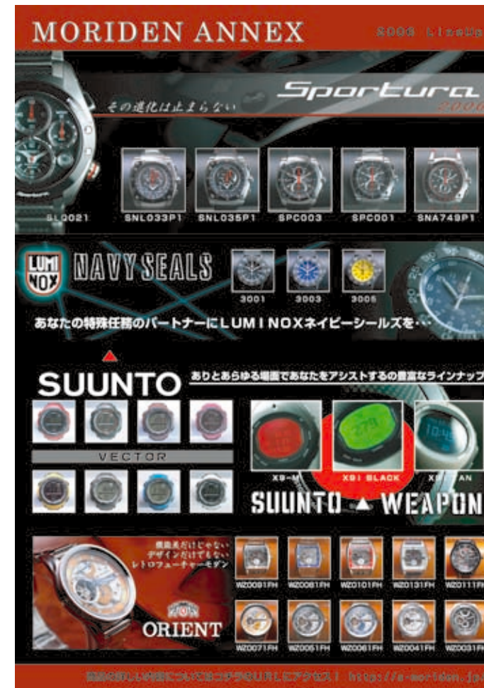
「2006年商品ラインナップ」チラシ 210×297mm