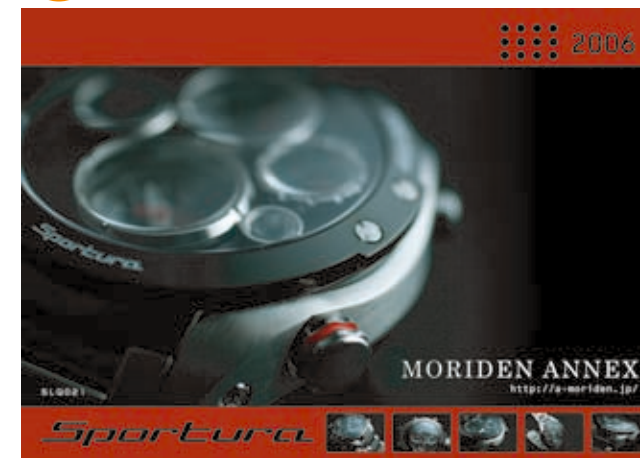
「SEIKO SPORTURA 製品のご案内」チラシ 297×210mm 表・裏