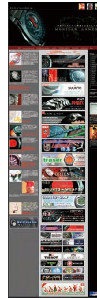
「MORIDEN ANNEX」ウェブサイト http://a-moriden.jp/